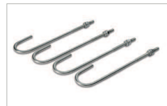
Kit 4 barre filettate M10 Kit 4 anchor bolts M10 AC 250