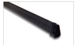
Bordo sensibile di sicurezza Pressure sensitive safety trim 269 L=1000 269 L=1500 269 L=2000 269 L=2500