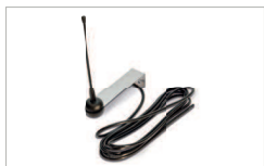
Antenna esterna / Outdoor antenna AC 30