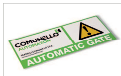
Tabella segnaletica / Signage table AC 40