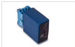
Sensore induttivo / Inductive sensor AC 240