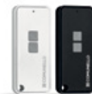
Émetteurs à code tournant, 2 canaux

KEEP 2 RC W / GKEEP2STN0W00 KEEP 2 RC B / GKEEP2STN0B00