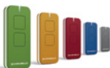
Kit de 5 émetteurs, 2 canaux, 2 canaux

KEEP 2 RC W / GKEEP2STN0W00 KEEP 2 RC B / GKEEP2STN0B00