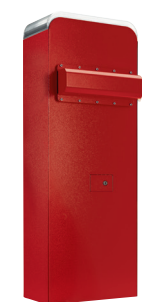
LT800-24V-R 1 Limit 800 24V